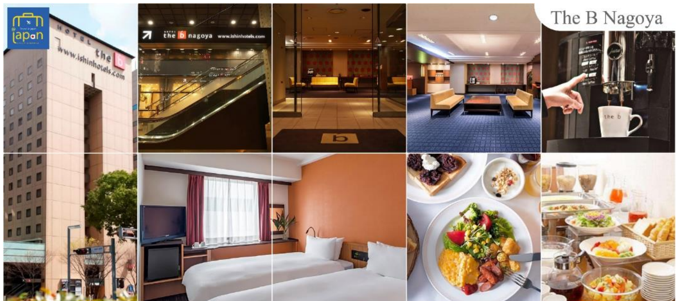
The B Nagoya

HOTEL THE B NAGOYA หรือเทียบเท่าระดับเดียวกัน