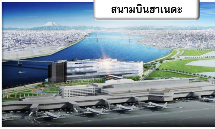
สนามบินฮาเนดะ

เวลา 23.15 น. ออกเดินทางสู่ สนามบินฟูคูโอกะ ประเทศญี่ปุ่น โดย สายการบินไทย เที่ยวบินที่ TG 682