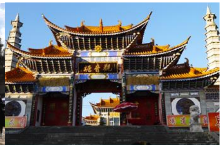
วัดเจ้าแม่กวนอิมเปลงกาย

วันที่ห้า เมืองต้าหลี่ -เมืองคุนหมิง- สวนน้ำตก “Kunming Waterfall Park” -เมืองโบราณกวนตุ๋