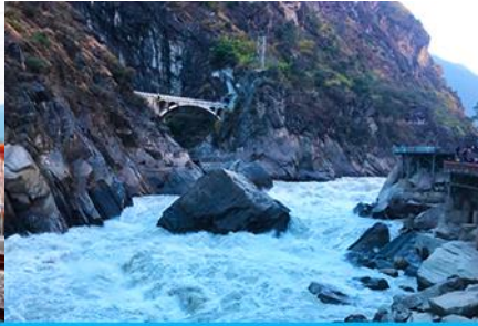
ช่องแคบเลือกระโจน