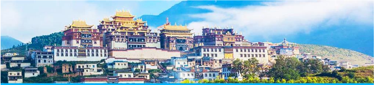
เมืองโบราณเขมกริลา

เมื่อเสร็จจากการเที่ยวชมช่องแคบเสื่อกระโจน นำท่านเดินทางต่อสู่เมือง แขวงกริลา ซึ่งอยู่ทางทิศตะวันตกเฉียงเหนือของมณฑลยูนนานซึ่งมีพรมแดนติดกับอาณาเขตนำซี ของเมืองลี่เจียง และอาณาจักรหิ ของเมืองหนิงหลง สถานที่แห่งนี้จึงได้ชื่อว่า ดินแดนแห่งความฝัน ที่ตั้งอยู่บนที่ราบสูงทางทิศตะวันตกเฉียงใต้ของจีน