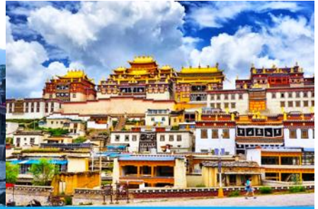
เมืองเซงการีล่า

วันที่สอง เมืองคุนหมิง-นั่งรถไฟความเร็วสูงสู่เมืองต้าหลี่-ช่องแคบเลือกระโจน-จางเตี้ยน-เมืองโบราณเซงการีล่า