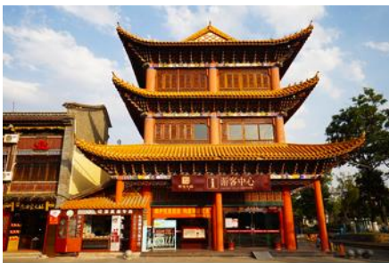
เมืองโบราณกวนตุ๋

พักที่ REGENT HOTEL ระดับ 4 ดาว หรือเทียบเท่าในเมืองต้าหลี่