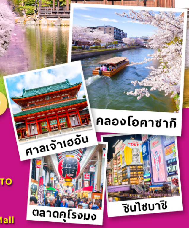
คลองโอคาซากิ