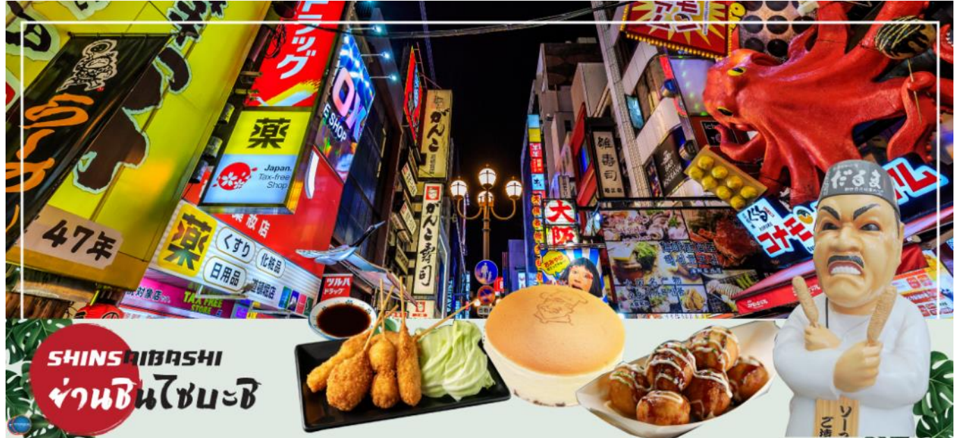
เย็น รับประทานอาหารเย็นอิสระตามอัธยาศัย

อิสระช้อปปิ้ง ย่านชินไซบาชิ (Shinsaibashi) บริเวณแหล่งช้อปปิ้งแห่งนี้มีความยาวประมาณ 600 เมตร เต็มไปด้วยร้านค้าปลีก ร้านแฟชั่นร้านเครื่องสำอางค์ ร้านรองเท้า กระเป๋า นาฬิกา ร้านกาแฟ ร้านอาหาร ร้านขนม ร้านเสื้อผ้าสตรีทแบรนด์ทั้งญี่ปุ่นและต่างประเทศ เช่น Zara H&M Beans ABC Mart เป็นต้น เรียกว่ามีทุกอย่างที่ต้องการรวมกันอยู่บริเวณนี้ ใกล้กันท่านสามารถเดินไปยัง ย่านโดทงโบริ (Dotonbori) ย่านบันเทิงยามค่ำคินดอลอดแนวถนนเลียบบคลองโดทงโบริ จากสะพานโดทงโบริบาชิไปจนถึงสะพานนิปปอนบาชิ ไฮไลท์!!! ใครๆ ก็เช็กอิน ถ่ายภาพคู่ ป้ายกูลิโกะแมน หรือ ป้ายโดทงโบริกูลิโกะ (Dotonbori Glico Sign) เป็นป้ายไฟนีออนรูปนักกรีฑากำลังวิ่งอยู่บนลู่วิ่ง ซึ่งถูกติดตั้งมาตั้งแต่ ปี ค.ศ.1935 นอกจากนี้ยังมีอีกหนึ่งสัญลักษณ์สถานที่นัดพบกันหลง นั่นก็คือ ร้านคานิดอรากุ (Kani Doraku) ซึ่งมีปύักษ์ขยับแขนและลูกตาได้อีกด้วย และห้ามพลาดสำหรับทาโกะยากิ อาหารท้องถิ่นของชาวโอซาก้า ที่มาถึงถิ่นแล้วต้องลอง Original Taste รับรองไม่ผิดหวังแน่นอน