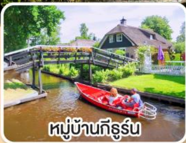
หมู่บ้านกีร์ฮิน