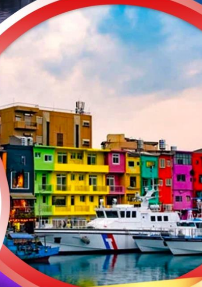
หมู่บ้านชาวประมงหลากสี