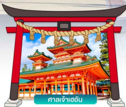
ศาลเจ้าเออิน