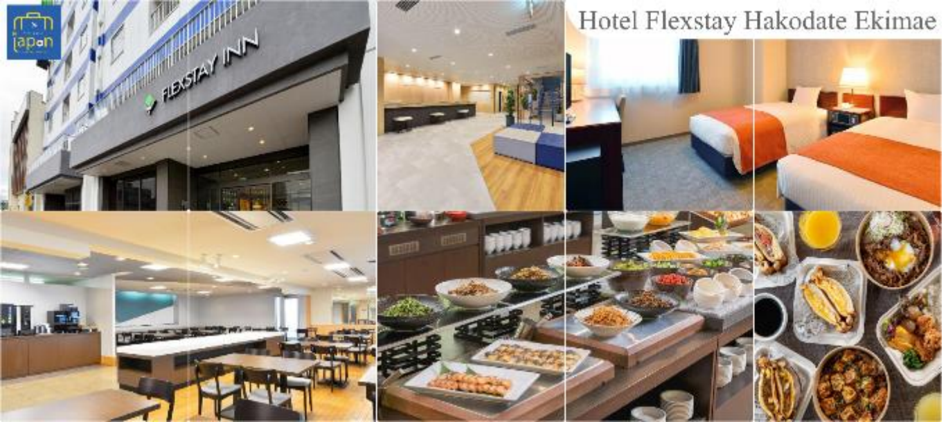
Hotel Flexstay Hakodate Ekimae

ที่พัก FLEX STAY INN HAKODATE EKIMAE หรือเทียบเท่าระดับเดียวกัน