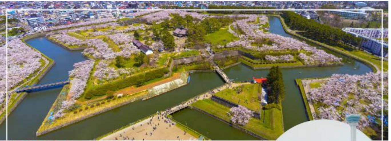
FORT GORYOKAKU ป้อมโกเรียวกาคู

วันที่สาม เมืองฮาโกดาเตะ – ป้อมโกเรียวกาคู (เข้าชม) – เมืองโนโบริเบทสึ – ศูนย์อนุรักษ์พันธุ์หมีสีน้ำตาล – เมืองซัปโปโร – ย่านชูชุกิโนะ