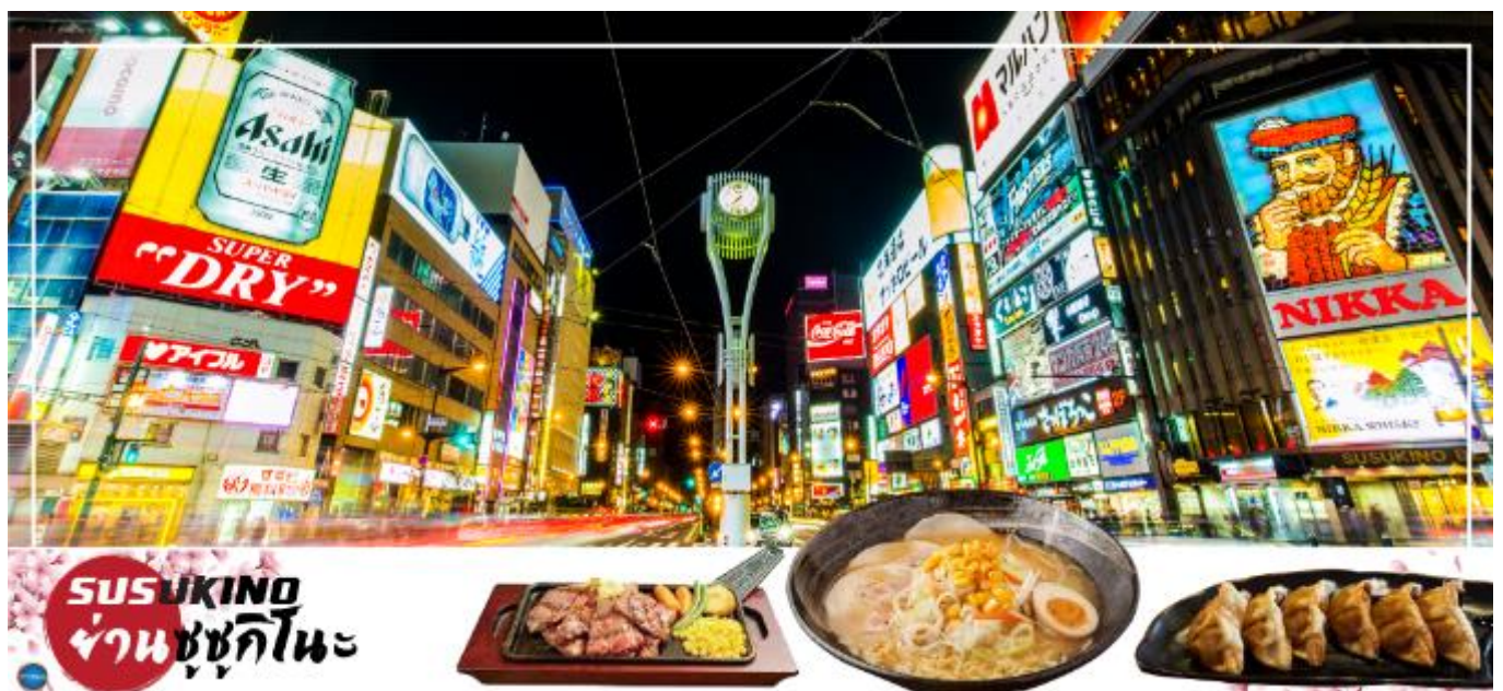
SUSUKINO ย่านซุซุกิโนะ

นำท่านเดินทางสู่ ย่านซุซุกิโนะ (Susukino) นับเป็นย่านที่เต็มไปด้วยแหล่งบันเทิงที่โด่งดังมากที่สุดของเมืองซัปโปโร (Sapporo) อีกทั้งยังเรียกได้ว่าเป็นย่านบันเทิงที่ใหญ่ที่สุดในทางตอนเหนือของญี่ปุ่นที่เดียวล่ะค่ะ บอกเลยว่าอยากมาบันเทิงใจยามค่ำคืนสัมผัสไลฟ์สไตล์แบบคนญี่ปุ่นแท้ๆ ต้องมาที่นี่ให้ได้เลยล่ะค่ะ เพราะเต็มไปด้วยร้านค้า บาร์ ร้านอาหาร ร้านคาราโอเกะ และตู้ปาจิงโกะ รวมกว่า 4,000 ร้าน บางร้านนี้เปิดจนถึงเที่ยงเที่ยงคืน