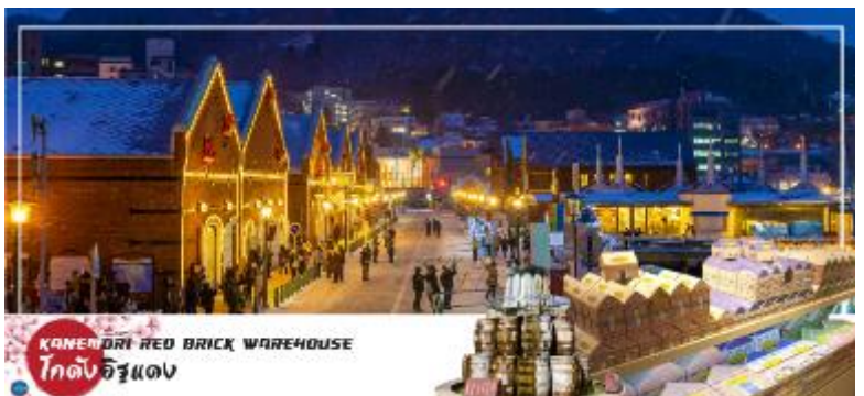
KANEMORI RED BRICK WAREHOUSE โกดังอิฐแดง

จากนั้นอิสระให้ท่านเดินเล่น ณ โกดังอิฐแดงริมน้ำ (Red Brick Warehouses) ได้ปรับปรุงมาจากคลังสินค้าอิฐสีแดงที่เคยใช้ค้าขายในปลายสมัยเอโดะ ตั้งอยู่ริมแม่น้ำของอ่าวฮาโกดาเตะ ศูนย์รวมแหล่งช้อปปิ้ง ร้านอาหาร และสถานบันเทิงที่ให้บรรยากาศเก๋ๆ นอกจากร้านขายของที่ระลึกที่ทันสมัย เสื้อผ้าแฟชั่น ร้านขายอุปกรณ์ตกแต่งบ้าน และร้านขนมหวานแล้ว ยังมีร้านอาหารลานเบียร์ โบสถ์สำหรับจัดพิธีแต่งงาน และบริการล่องเรือเพื่อชมทิวทัศน์ของอ่าวฮาโกดาเตะอีกด้วย