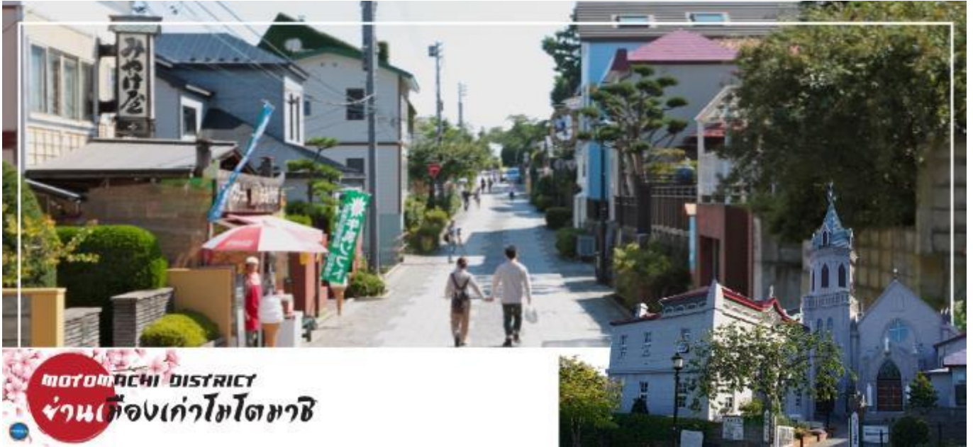
MOTOMACHI DISTRICT ย่านเมืองเก่าโมโตมาชิ

เที่ยง รับประทานอาหารกลางวันเป็นเบนโตะบนบัสเพื่อความรวดเร็วในการเดินทาง (1)