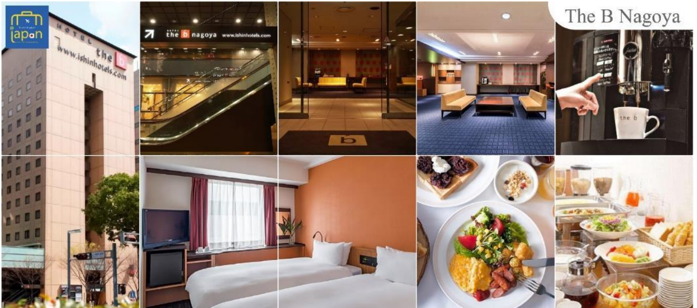
The B Nagoya

พักที่ HOTEL THE B NAGOYA หรือเทียบเท่าระดับเดียวกัน