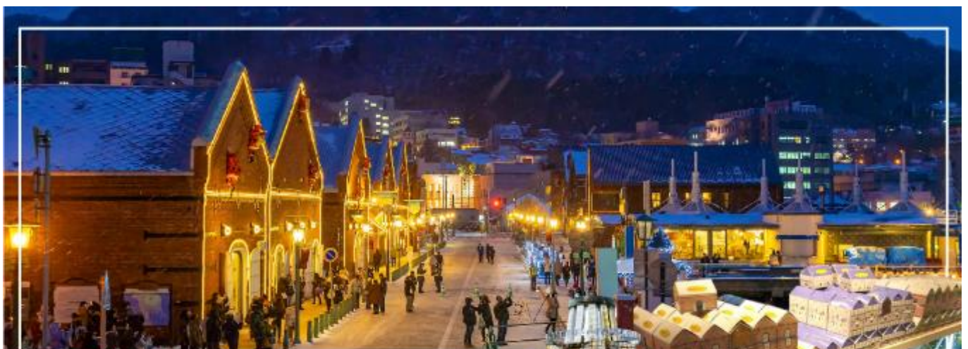
KANEMORI RED BRICK WAREHOUSE โกดังอิฐแดง

อิสระให้ท่านเดินเล่น ณ โกดังอิฐแดงริมน้ำ (Red Brick Warehouses) ได้ปรับปรุงมาจากคลังสินค้าอิฐแดงที่เคยใช้ค้าขายในปลายสมัยเอโดะ ตั้งอยู่ริมแม่น้ำของอ่าวสาโกดาเตะ ศูนย์รวมแหล่งช้อปปิ้ง ร้านอาหาร และสถานบันเทิงที่ให้บรรยากาศเก่าๆ นอกจากนี้ร้านขายของที่ระลึกที่ทันสมัย เสื้อผ้าแฟชั่น ร้านขายอุปกรณ์ตกแต่งบ้าน และร้านขนมหวานแล้ว ยังมีร้านอาหาร ลานเบียร์ โบสถ์สำหรับจัดพิธีแต่งงาน และบริการล่องเรือเพื่อชมวิวทิวทัศน์ของอ่าวสาโกดาเตะอีกด้วย