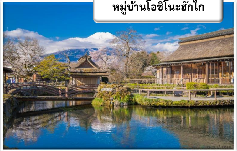
หมู่บ้านโอชิโนะฮักไก

หมู่บ้านโอชิโนะ ฮักไก (Oshino Hakkai Village) เป็นหมู่บ้านที่ตั้งอยู่ใกล้ภูเขาไฟฟูจิ บริเวณทะเลสาบยามานาคาโกะ (Lake Yamanakako) ซึ่งในปี 2013 ภูิจังได้รับเลือกให้เป็นมรดกทางวัฒนธรรมของโลก ที่นี้เองก็ได้รับเลือกในฐานะส่วนหนึ่งของฟูจิซังด้วย และเพราะในบริเวณนี้มีบ่อน้ำใส ๆ รวมกันกว่า 8 บ่อ ทำให้คนไทยเราเรียกที่นี่ว่า "หมู่บ้านน้ำใส" นั่นเอง