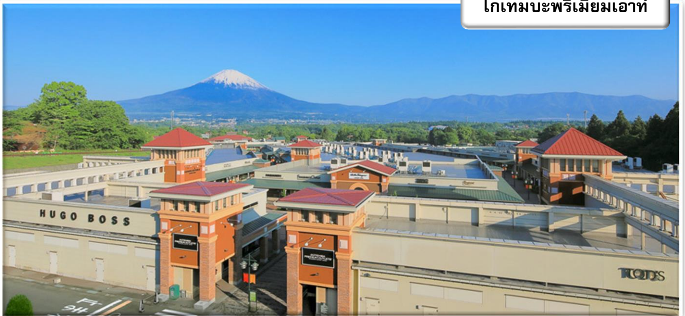
โกเทมบะพรีเมียมเอาร์ท

นำท่านสู่ โกเทมบะพรีเมียมเอาร์ทเล็ด ซุปเปอร์มอลล์ที่ใหญ่ที่สุดในญี่ปุ่น แหล่งช้อปปิ้งยอดนิยมประจำสถานที่ท่องเที่ยวรอบแนวภูเขาไฟฟูจิ ภายในมีร้านค้าแบรนด์เนมกว่า 210 ร้าน ศูนย์อาหารอีก 23 แห่ง ซึ่งแวดล้อมไปด้วยภูมิทัศน์ทางธรรมชาติสวย ๆ ทั้งทะเลสาบ สวนดอกไม้ และภูเขาไฟฟูจิ