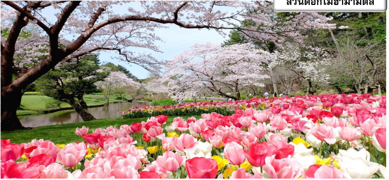
สวนดอกไม้ฮามามัตสึ

สวนดอกไม้ฮามามัตสึ สวนพฤกษศาสตร์ที่อยู่ติดกับทะเลสาบฮามานะ มีทัศนียภาพธรรมชาติที่สวยงามและเต็มไปด้วยดอกไม้ที่พันธุ์กว่า 3,000 ชนิด รวมถึงต้นซากุระ 1,300 ต้น และทิวลิป 5 แสนดอก นอกจากนี้ยังมี "สวนดอกกุหลาบ" กว่า 1000 ต้น และ "สวนฮานะชิโอะ" ที่เต็มไปด้วยพรรณไม้ญี่ปุ่นกว่า 1 ล้านต้น อีกทั้งยังสามารถชมดอกไม้บานตามฤดูกาล เช่น ในฤดูใบไม้ร่วงก็สามารถชมโมมิจิ(ใบไม้แดง)ได้