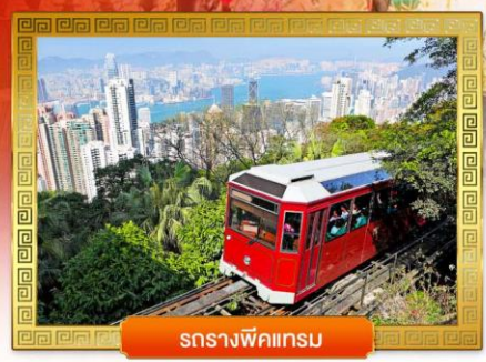
รถรางฟิคแตรม