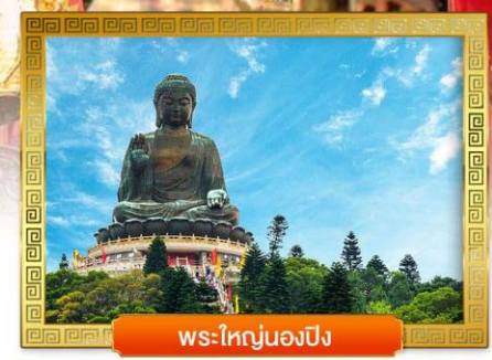
พระใหญ่ของปิง