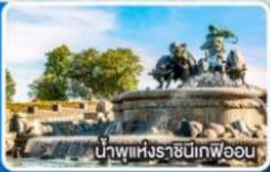
น้ำพุแห่งราชินีเฟอออน