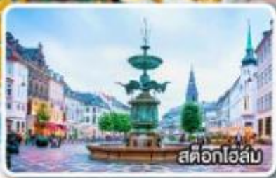
สต็อกโฮล์ม