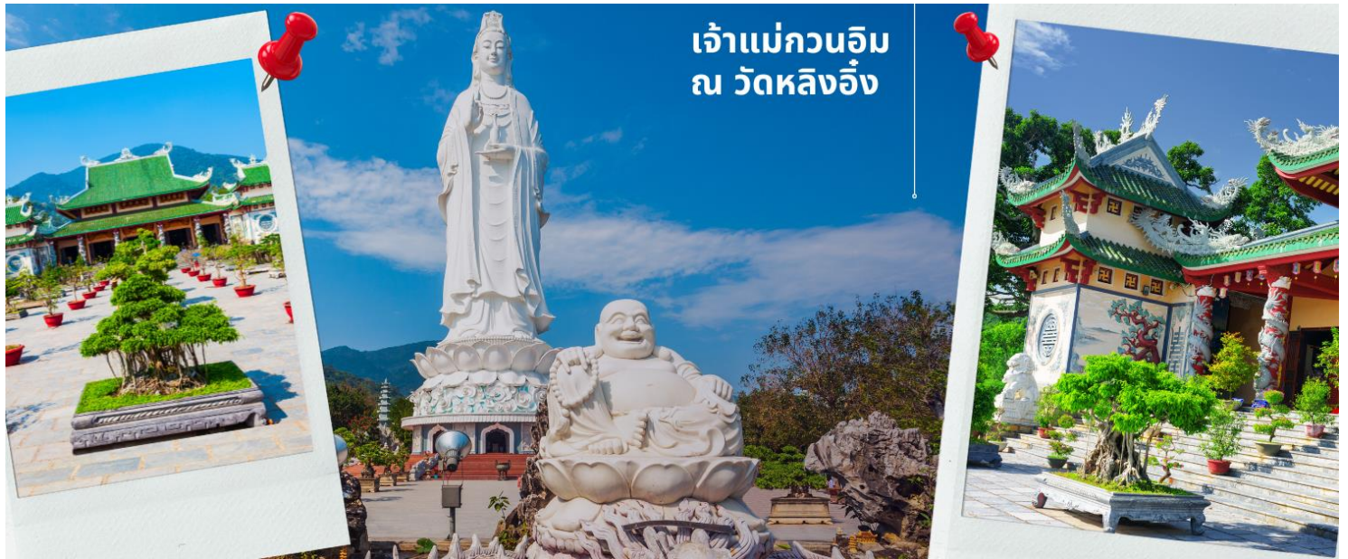
เจ้าแม่กวนอิม ณ วัดหลิงอิ่ง

นำท่านมัศจรรย์องค์ เจ้าแม่กวนอิม ณ วัดหลิงอิ่ง อยู่บนเกาะเซินตรา (Son Tra) ทางเหนือของเมืองดานัง เป็นวัดใหญ่ที่สุดของที่นี่ รูปปั้นปูนขาวของเจ้าแม่กวนอิมยืนหันหลังให้ภูเขา หันหน้าออกสู่ทะเลเพื่อเป็นการปกป้องคุ้มครองชาวประมงที่ออกไปหาปลา เสียงระฆังวัดที่ตีประสานกับเสียงคลื่นนั้นช่วยให้ชาวเรือรู้สึกสงบ และสร้างขวัญกำลังใจอย่างดีเยี่ยม และเป็นทีเคารพนับถือของคนดานัง