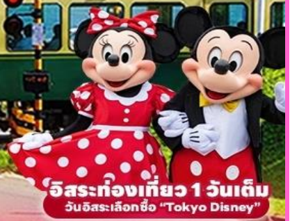
อิสระท่องเที่ยว 1 วันเต็ม วันอิสระเลือกชื่อ "Tokyo Disney"