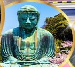
พระใหญ่ คามาคุระ