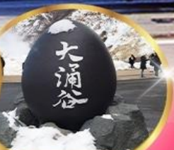
หุบเขาโอวาคุดานิ