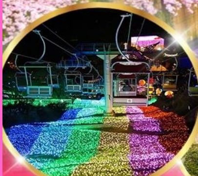
งานไฟซากามิโกะ อัลลูมิเลีย