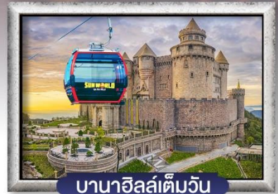
บาน่าฮิลล์เต็มวัน