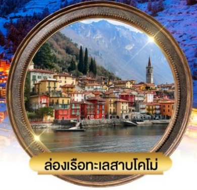
ล่องเรือทะเลสาบโคโม