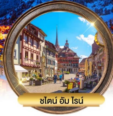
ชิลอน อัม โรน