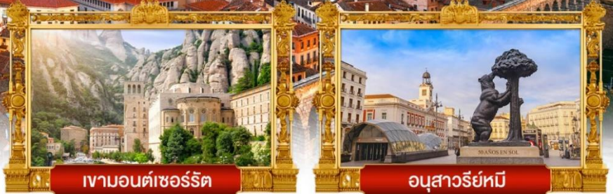
เวิวมอนต์เซอร์รัต