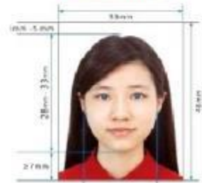
Paper Photo for Visa Application Form