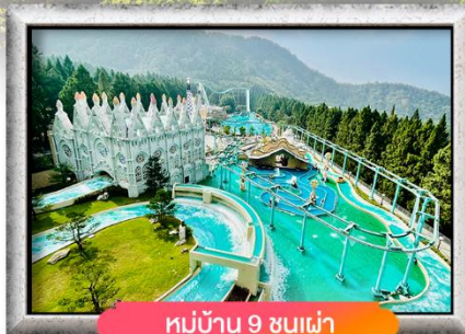
หมู่บ้าน 9 ชนเผ่า