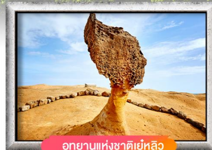
อุทยานแห่งชาติเย่หลิว

เมนู สุดพิเศษ !! เสี่ยวหลงเปา, ปลาประจานริบคิ, ซาบูบุฟเฟต์สไตล์ไต้หวัน