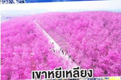
เวาหยี่เหลียง