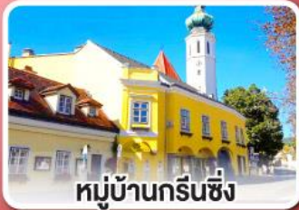
หมู่บ้านกรีนซิ่ง