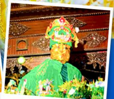
ขอพสแม่ยักษ์