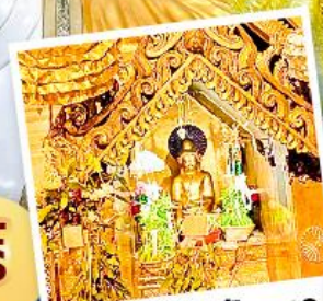
พระสุริยันจันทร