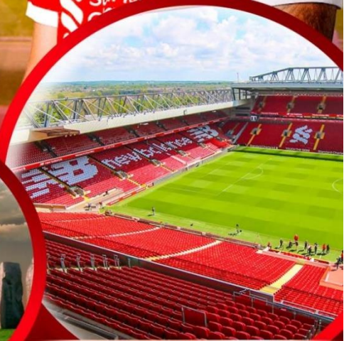
เข้าชมสนามแอนฟิลด์

พิเศษ เข้าชมสนามกีฬาแอนฟิลด์ (ANFIELD STADIUM)