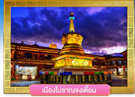
เมืองโบราณจงเตี้ยน