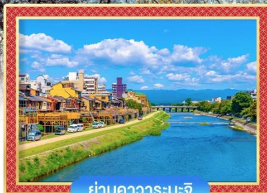
ย่านคาวาระมะจิ