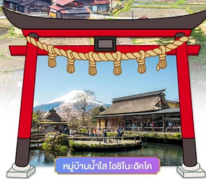
หมู่บ้านน้ำใส โอชิโนะฮักไต