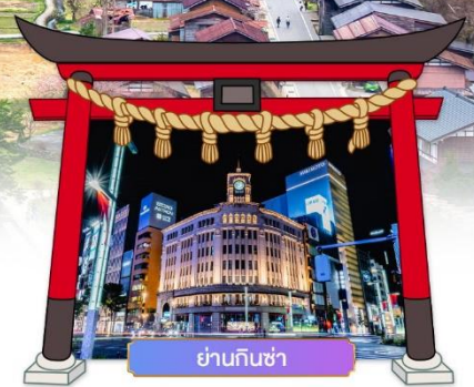
ย่านกินซ่า