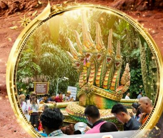
ป่าชะโนด