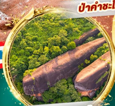
หินสามวาฬ