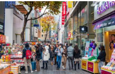
ทางเดินอย่างสวยงาม

ย่านเมียงดง เป็นย่านช้อปปิ้งที่คึกคักอันดับต้นๆ ใจกลางกรุงโซล บริเวณถนนเรียงรายด้วยอาคารร้านค้ามากมายหลายแบรนด์ไม่ว่าจะเป็นเสื้อผ้า กระเป๋า รองเท้า เครื่องสำอาง คาเฟ่ และร้านอาหารหลากหลายประเภท อีกทั้งยังมีแผงสตรีทฟู้ดเกาหลีต่างๆ ให้ได้ลองลิ้มชิมรส ย่านนี้จึงเป็นสถานที่ยอดนิยมของนักท่องเที่ยวและเป็นถนนช้อปปิ้งที่มีชีวิตชีวาเป็นอย่างมาก