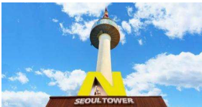
คืนได้แบบ 360 องศา

สวนสนุกล็อตเต้เวิลด์ สวนสนุกในร่มที่มีเครื่องเล่นมากมาย โดยพื้นที่ภายในจะแบ่งเป็น 2 โซนใหญ่ๆ คือ Adventure เป็นสวนสนุกในร่มที่รวมเครื่องเล่นไว้มากมาย ทั้งไวกิ้ง ม้าหมุน บ้านผีสิง ฯลฯ รวมถึงมีลานไอซ์สเก็ตในร่มอีกด้วย ส่วนอีกโซนชื่อว่า Magic Island เป็นโซนกลางแจ้ง อยู่ติดกับทะเลสาบชกซอนไฮซู มีปราสาทสวยๆ ตั้งเด่นเป็นสง่า ตรงนี้แหละค่ะเป็นจุดถ่ายรูปที่คนเกาหลีฮิตมากๆ ถ้าจะให้ปังสุดๆ ต้องเช่าชุดนักเรียนน่ารักๆ มาใส่ถ่ายรูปด้วยนะ โซนกลางแจ้งมีเครื่องเล่นไฮไลท์เป็น Gyro Drop ดรอปทาวเวอร์ สูง 70 เมตร และเครื่องเล่นมันส์ๆ อีกมากมาย ใครชอบความท้าทายต้องไม่พลาด